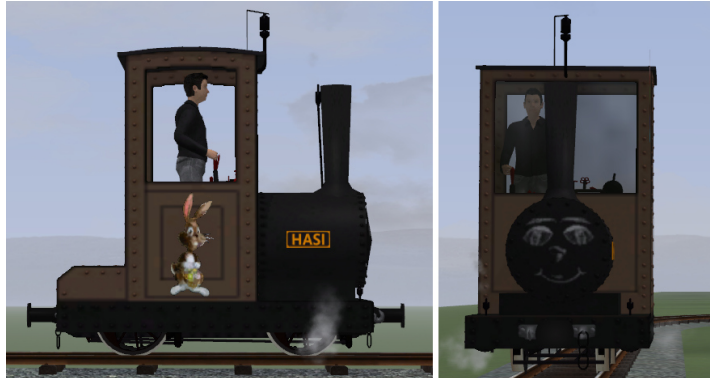
Lok olivbraun, Fahrwerk schwarz, Gesicht auf Rauchkammertür (keine Glocke), schwarze Pfeife und Ventile (Modellname: B2nt HASI (KK1) – Dateiname: AA_HASI_KK1) (ursprünglich in V11N_WBF_Ostern2018 enthalten)

Die folgenden Modelle sind als Userwunsch von Dennis aus Kopenhagen entstanden: