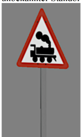
1938_120_KK1 1938 BÜ unbek unbekannter Standort