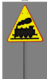
1938_122_KK1 1938 BÜ aSK2 aus Schilder-Katalog