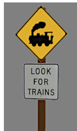
1938_116h_KK1 1938 BÜ AUS & LfT