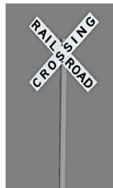
1938_117_KK1 1938 BÜ RC GB