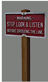
1938_106h_KK1 1938 STOP LOOK & LISTEN GB