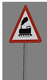
1938_121_KK1 1938 BÜ aSK1 aus Schilder-Katalog