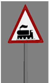
1938_110_KK1 1938 BÜ GB5