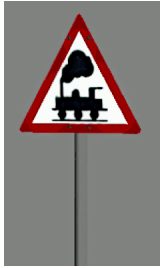
1938_100_KK1 1938 BÜ E

Ein (h) zeigt an, daß es dieses Schild zusätzlich an einem Holzpfehl gibt, das h ohne Klammern, daß das Schild nur mit Holzpfehl vorhanden ist.