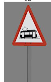
1938_124_KK1 1938 BÜ STRABA CH – Signal 1.18

(Dateiname: 1938_100_KK1 - 1938_124(h)_KK1 – enthalten in: V11FKK10106)