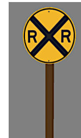
1938_113h_KK1 1938 BÜ RR GB