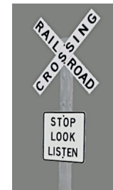
1938_118h_KK1 1938 BÜ RC & SLL GB