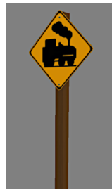
1938_111h_KK1 1938 BÜ GB6