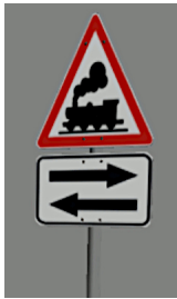
1938_105_KK1 1938 BÜ D alt & →← Osthollstein