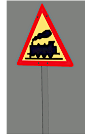
1938_104_KK1 1938 BÜ PL