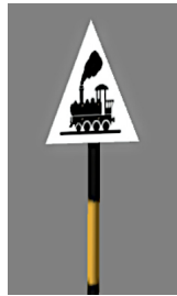
1938_107_KK1 1938 BÜ Weiss GB