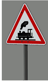
1938_101_KK1 1938 BÜ CZ