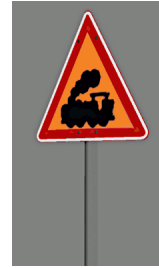
1938_103_KK1 1938 BÜ KOR