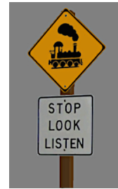
1938_109h_KK1 1938 BÜ GB3 & Z