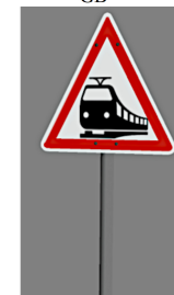
1938_123_KK1 1992 unbeschränkter BÜ D seit 1992