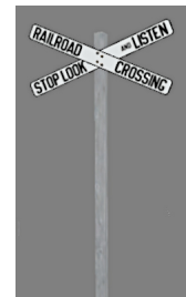
1938_119h_KK1 1938 BÜ RC SLal GB