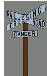
1938_114h_KK1 1938 BÜ RC&D GB