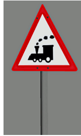
1938_102_KK1 1938 BÜ ??? Spielzeugschild