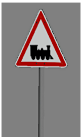
1938_115_KK1 1938 BÜ D2 unbekannter Standort