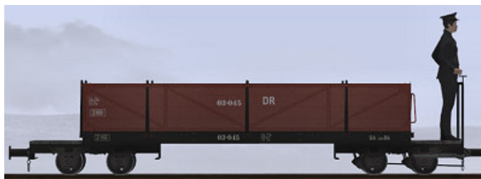
Baujahr 1918 (O&K), Umbau nach 1950 (WEM) – 03-045 (Modellname: WEM Personenwagen 03-045 – enthalten in: V11X_WBF_SS6_042)