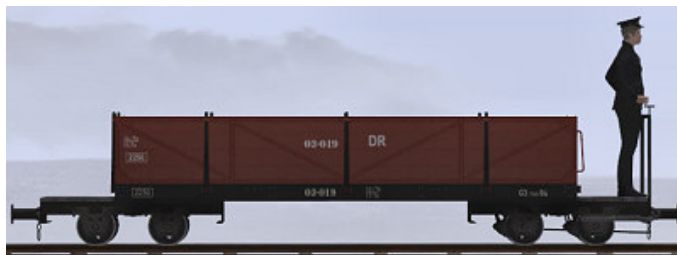
Baujahr 1918 (O&K), Umbau nach 1950 (WEM) – 03-019 (Modellname: WEM Personenwagen 03-019 – enthalten in: V11X_WBF_SS6_042)