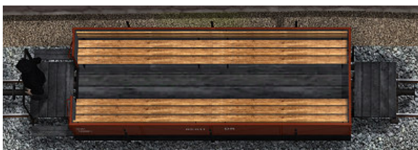
Wagen mit braunen Sitzbänken: 03-011

Alle Wagen haben einen Bremsr, der per Schieberegler oder Kontaktpunkt „aussteigen“ kann (Größe wird auf Null gesetzt).