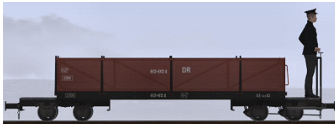
Baujahr 1919 (Weimar), Umbau nach 1950 (WEM) – 03-024 (Modellname: WEM Personenwagen 03-024 – enthalten in: V11X_WBF_SS6_042)