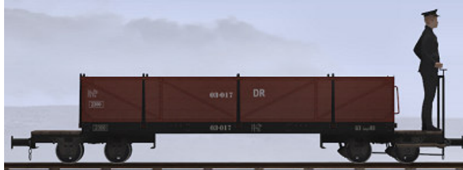
Baujahr 1918 (O&K), Umbau nach 1950 (WEM) – 03-017 (Modellname: WEM Personenwagen 03-017 – enthalten in: V11X_WBF_SS6_042)