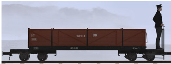
Baujahr 1918 (O&K), Umbau nach 1950 (WEM) – 03-011 (Modellname: WEM Personenwagen 03-011 – enthalten in: V11X_WBF_SS6_042)