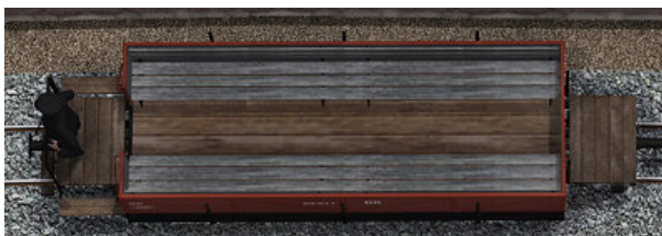
Wagen mit grauen Sitzbänken: 03-017